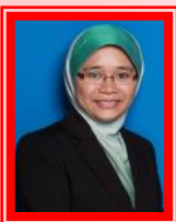
NOORJSAH TALJDD PEG. HAL EHWAL JSLAM KANAN PUSAT JSLAM UMS ♥ ♥ ♥ ♥

♥ Tumpas Rebah dalam pelukan Mendua dan berpisah Mainan cinta zaman sekarang Awas usah terjebak Kerana selangkah jua menapak Tak bisa melangkah mundur... ♥